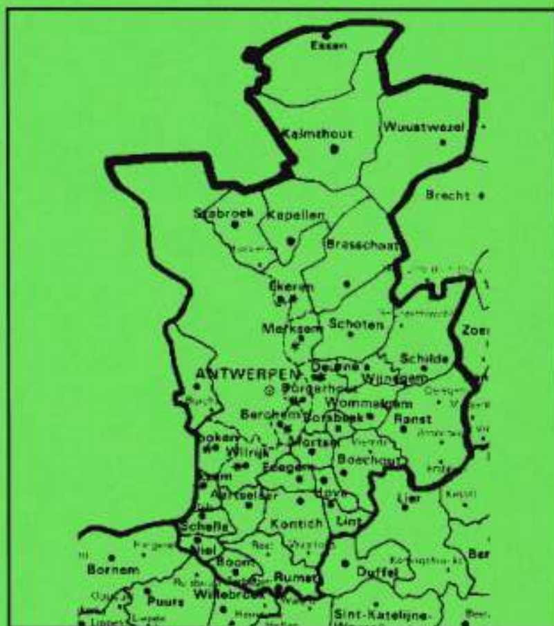
Gebied van de Afdeling "ANTWERPEN"